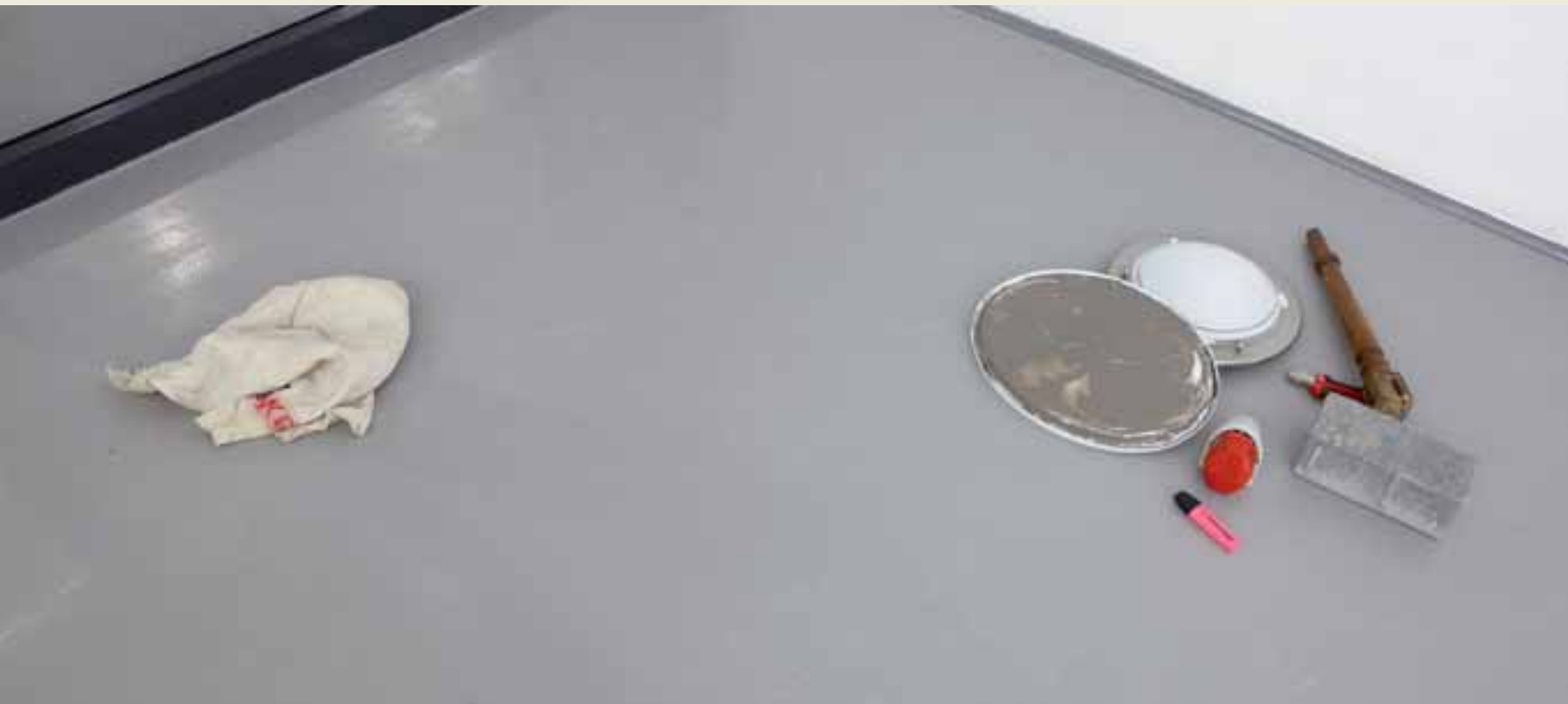
Andreas Slominski: Adventskalender, 2008