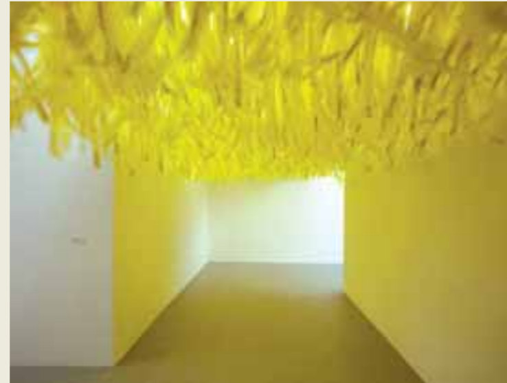
Sebastian Hempel: Strom, 2006

In »Vorkuta« betritt man einen eisigen Kühlraum und kann die knisternde Spannung der Verunsicherung im wörtlichen Sinne vor sich sehen, während der hohe Ledersessel nicht nur etwas Sicherheit, sondern auch unerwartete Wärme bietet.