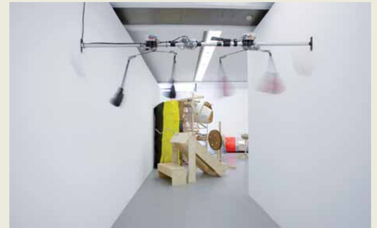
Christian Schnurer: Schlägerei, 2007

Nach welchen Mechanismen funktioniert die Welt? Was sind geordnete, sinnvolle, zielgerichtete Vorgänge und was läuft aus dem Ruder? Wie viel Absurdität liegt im anscheinend Normalen und wie viel Sinn im vermeintlich Sinnlosen? Wenn zeitgenössische Künstler sich in ihren Arbeiten mechanischen, elektronischen oder maschinellen Konstruktionen zuwenden, dann beschäftigen sie sich modellhaft auch mit der Welt. Gesellschaftliches Leben wird durch ganz verschiedene Funktionszusammenhänge bestimmt, in denen jeder Einzelne handelt und reagiert. Vielleicht sind die »zeitgemäßen Apparate« Modellwelten, in denen die Schönheit, die Erneuerungskraft, die Absurditäten und das Ungebändigte unserer Lebensbedingungen gleichermaßen sichtbar und erfahrbar werden. Kunst bietet in dieser Weise die Möglichkeit, einen Schritt zurück zu treten und der eigenen Existenz in all ihrer Facettenhaftigkeit aus neuer Perspektive zu begegnen.