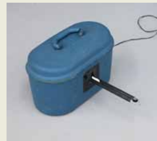
Andreas Fischer: Lobeslappen, 2008 Mouli, 2005 Eierschaukel, 2005 Fuck Außenansicht, 2007