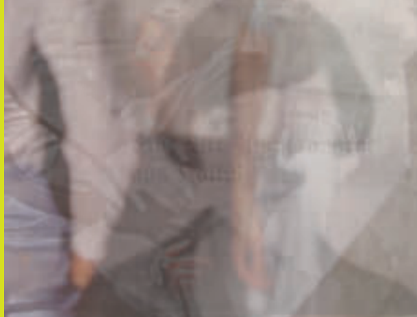
Susanne M. Winterling, O.T. (Angstapparat, Effi Briest), 2007 Fotocollage, 60 x 80 cm