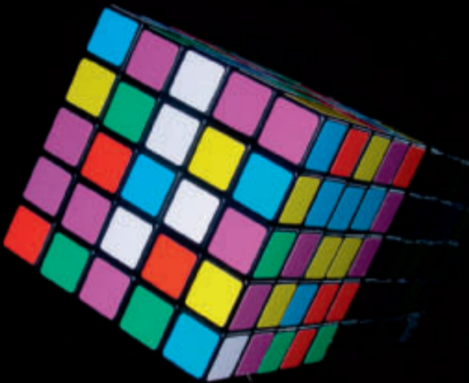
Susanne M. Winterling, The system in your hands, 2008/09 c print, 30 x 45 cm