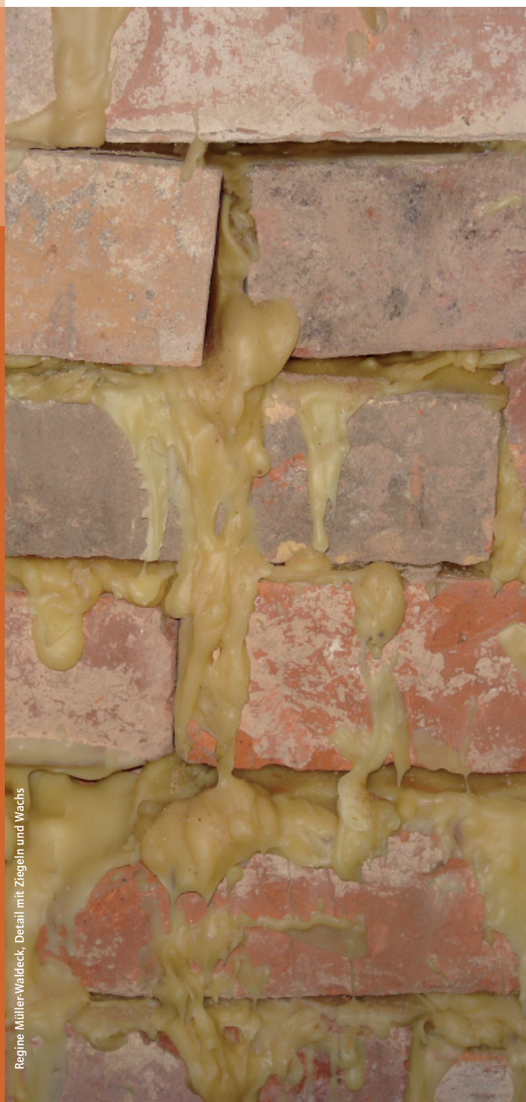
Regine Müller-Waldeck, Detail mit Ziegeln und Wachs