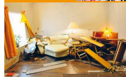
Titelseite: SUSANNE KUTTER Die Zuckerdose , 2012, Video (Setfoto)