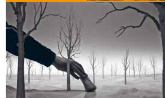
HANS OP DE BEECK Staging Silence (2) , 2013, Video (Still) Mit Genehmigung des Künstlers und Galleria Continua, San Gimignano / Beijing / Le Moulin; Galerie Krinzinger, Vienna; Marianne Boesky Gallery, New York; Galerie Ron Mandos, Rotterdam / Amsterdam.