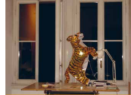
ANDREA BÜTTNER „Lass einen mit Gas gefüllten Tigerluftballon steigen. Während der Dauer der Ausstellung wird er sinken.“ Fallen lassen, 2010, 16 Aufgaben, © VG Bild-Kunst, Bonn 2013