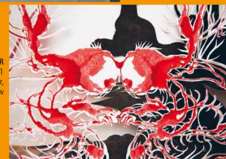
NADJA SCHÖLLHAMMER Mirror I (Detail aus Insomnia ), 2011 © Nadja Schöllhammer, Foto: Eric Tschernow